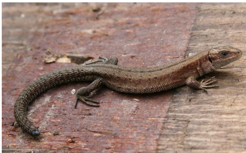
Jonge Levendbarende hagedis, gezien op 14 september 2011 bij het Spoorgat

gens de auteurs heeft het te maken met de toestand van het bos in het verleden. Vanaf de Middeleeuwen raakte de stuwwal steeds meer ontbost en kwam er steeds meer heide. Het hoogtepunt werd bereikt in de 17de eeuw. De droge heide was een perfect leefklimaat voor de Zandhagedis, die het goed deed, maar voor de Levendbarende hagedis was het te droog en het dier stierf uit. Later, toen de herbebossing startte, werden de omstandigheden weer gunstig voor de Levendbarende hagedis. Zijn leefgebied was echter teruggedrongen tot De Bruuk en de Hatertse vennen. Vanuit De Bruuk was het onmogelijk om het Groesbeekse bos te bereiken; er lag een brede strook landbouwgrond tussen, die onmogelijk gepasseerd kon worden. De afstand van De Bruuk tot het Reichswald was gering en via De Bruuk raakten delen van het Reichswald weer gekoloniseerd door de Levendbarende hagedis. Dat het dier bij De Diepen niet vanuit het Reichswald via de smalle doorgang de St. Jansberg kon koloniseren, zou komen doordat het bos daar