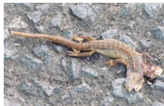
Dode Levendbarende hagedis gefotografeerd in de Kranenburger Bruch op 1 oktober 2011